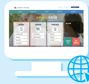
국시원 요양보호사 홈페이지 합격자조회 메뉴