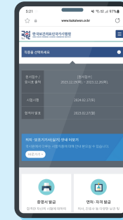
국시원 모바일 홈페이지 합격자조회 메뉴